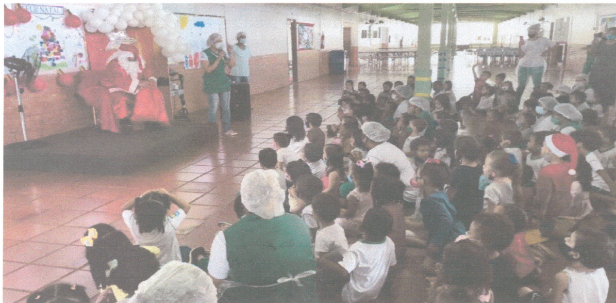
Festa realizada em 10/12/2021.

2.3- Laboratório de Informática: dado o regresso das atividades presenciais com as crianças, não demorou muito para os voluntários do Laboratório de Informática regressarem. No dia 13/09/2021 foram retomadas esta atividade extracurricular com os nossos pequeninos do Maternal II, atendendo a todos os protocolos de segurança, trazendo as primeiras noções da área digital através jogos lúdicos e apropriados à faixa etária.